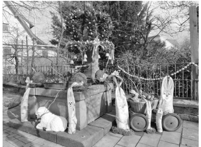
Osterbrunnen in Epfenbach

Die Vorstandschaft des LandFrauenverein wünscht allen eine schöne Osterzeit und hofft auf ein baldiges Wiedersehen.