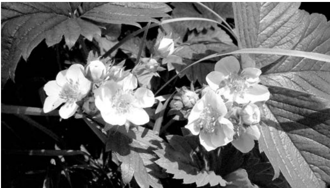
Für immertragende Erdbeeren, deren Erntezeit von Juni bis Oktober reicht, ist die Pflanzzeit im April ideal.

Für immertragende Erdbeeren , deren Erntezeit von Juni bis Oktober reicht, ist die Pflanzzeit im April ideal. Einen besonders guten Start haben die Setzlinge, wenn zuvor verrotteter Stallmist untergegraben oder Komposterde auf das Pflanzbeet verteilt wurde. Auf kargen, ausgelaugten Böden sollten es zehn Liter Komposterde je Quadratmeter sein. Ansonsten genügt die halbe Menge.