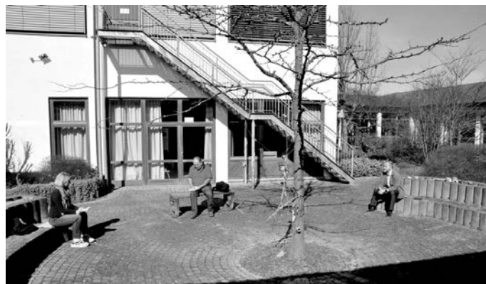
Bild: Im Schulhof diskutierten Vertreter der Schulleitung, des Elternbeirats und der Gemeindeverwaltung über die Auswirkungen der Pandemie für den Schulalltag

Fraglich ist für ihn, ob der Föderalismus in der Pandemiebekämpfung wirklich zielführend ist und er bemerkt, dass dabei die Interessen des Datenschutzes über denen des Gesundheitsschutzes stehen würden. Hier müsse man die Entscheidung treffen, was einem wichtiger ist.