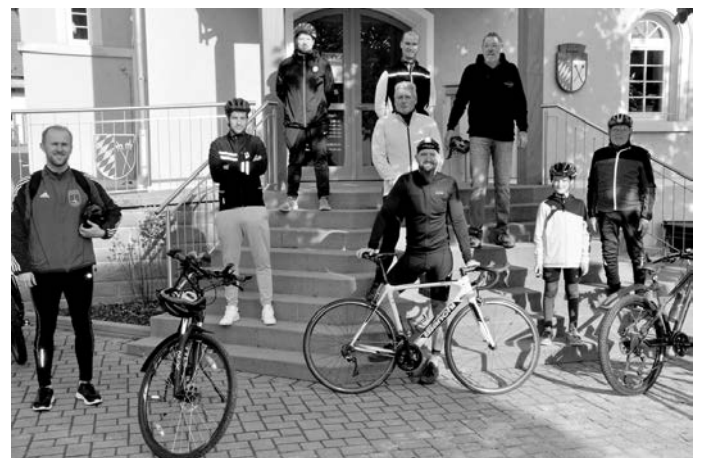
Das waren die Eschelbronner Stadtradeln 2020, die die meisten Kilometer gesammelt haben und die auch in diesem Jahr wieder an den Start gehen werden

Aus diesem Grund sollte Eschelbronn das letztjährige Ergebnis mindestens wiederholen oder besser übertreffen, um das wohlverdiente Siegesbier bei der Abschlussfeier doch noch genießen zu können.