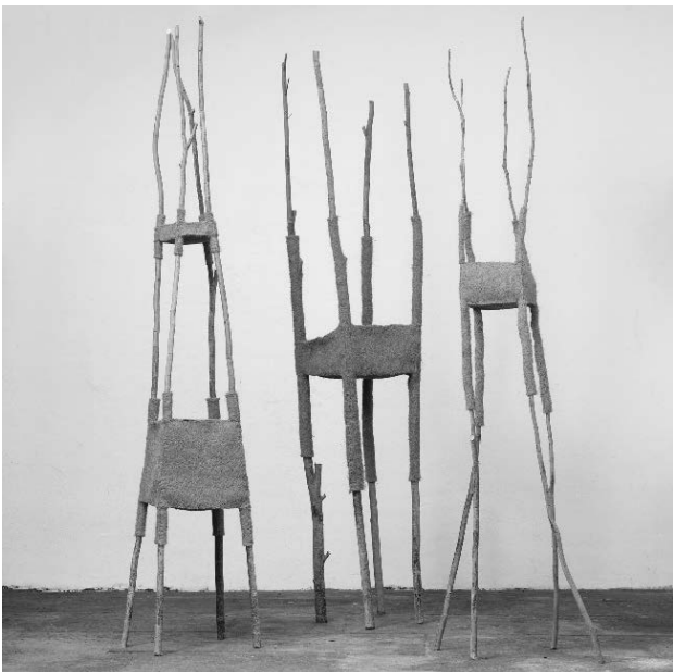
Kunstwerk von Elisabeth Kamps im Ladenburger Kreisarchiv (pull over, 2014, Holz, Kokostasermatten, genäht, 250 cm hoch)

Weitere Informationen unter www.radiale.net