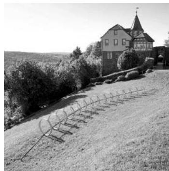
Installation „Rolling Rainbow“ von Michael Bacht auf dem Hang hinter dem Kommandantenhaus.

Weitere Informationen unter www.radiale.net