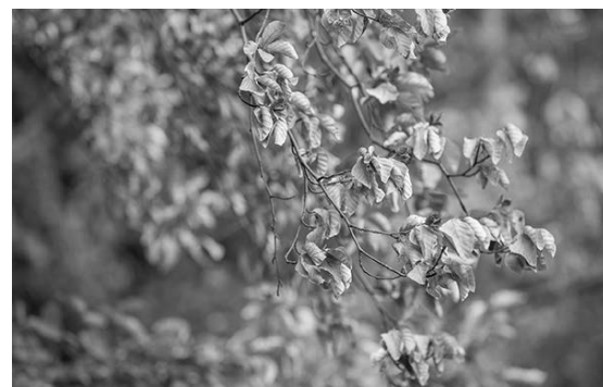
Teilweise verfärbte Belaubung an geschädigten Buchen

Die Beraterinnen und Berater des Kreisforstamtes stehen den Waldbesitzenden zur Seite. Durch die im Juli 2020 vorgestellte Verwaltungsvorschrift ‚Nachhaltige Waldwirtschaft‘ werden sie bei der Schadensbewältigung neben einer fundierten Beratung auch finanziell durch das Land unterstützt. Im Zentrum der Fördermaßnahmen stehen die Aufarbeitung von Schadholz und die Wiederbewaldung. Ziel sind klimastabile Mischwälder mit standortangepassten Baumarten. Weitere Informationen rund um den Wald in Baden-Württemberg finden Sie unter www.mlr-bw.de/wald . Bei Fragen können Sie sich an das Kreisforstamt unter 06221 522-7600 oder per Mail an: forstamt@rhein-neckar-kreis.de wenden.