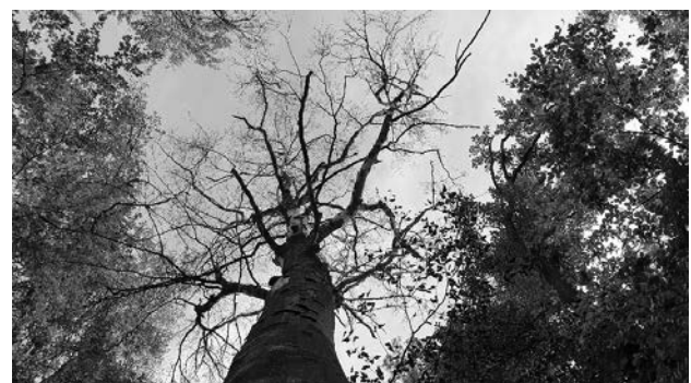
Abgestorbene Buche im Stadtwald Weinheim