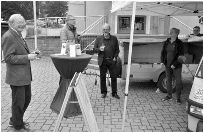
Bild 02 Vespertour: Auch einige Gottesdienstbesucher besuchten nach dem Kirchengang gern den Weinstand auf dem Marktplatz

Weitere Termine zur Teilnahme an den Wanderungen und zum Abholen der Vespertaschen sind am 4. Juli, 26. September und 24. Oktober. Jedesmal ist zwischen 10 Uhr und 12 Uhr das Schreinerdorf der Ort der Übergabe.