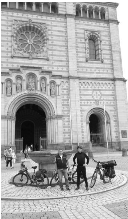
Eschelbronn im Radsport-Ausnahmestand: Zwei Teammitglieder der „Equipe Velo Village Eschelbronn“ bereiten sich bei einer Tour an den Speyrer Dom auf das „Stadtradeln“ vor.

Lassen auch Sie sich für das erste Wochenende des Stadtradelns etwas Spektakuläres einfallen und fahren Sie möglichst viel und möglichst weit. Lassen Sie die kompletten nächsten drei Wochen von meinem Lebensmotto „Live slow, ride far“ geprägt sein.