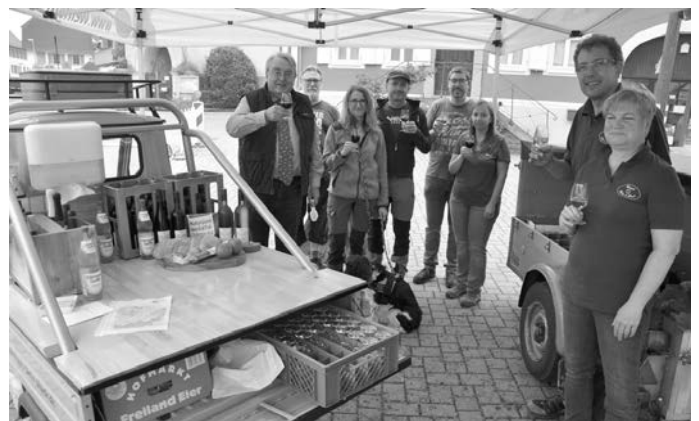
Bild 01 Vespertour: Gut gelaunt starteten die Wanderer mit ihren Vespertaschen auf ihre Wandertour rund um Eschelbronn

Die Tourteilnehmer sollen nicht nur die Landschaften im Naturpark genießen, sondern auch deren regionale Köstlichkeiten. Neben den örtlichen Wandervorschlägen bekommt man also auch noch eine Auswahl von lokalen Leckereien mit auf den Weg.