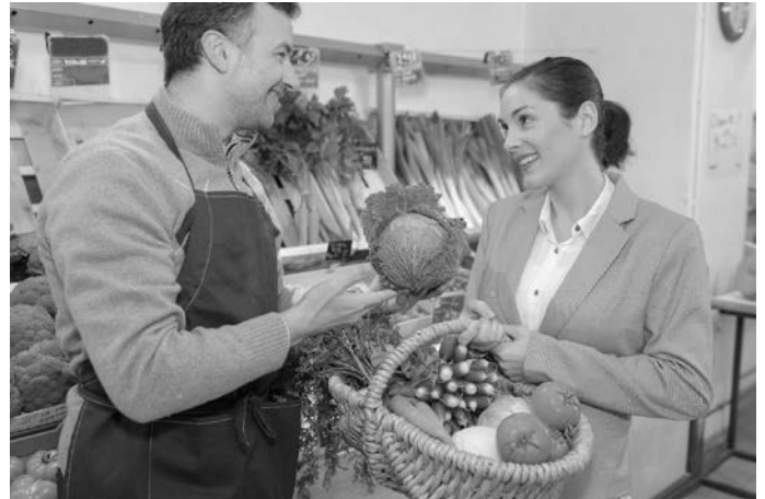
Nett und klimafreundlich: Beim Händler nebenan gibt's Produkte aus der Region – und Sie kommen ohne überflüssige Verpackung aus.

den Einkaufskorb oder -tasche mitnehmen. Für Spontankäufe einfach eine kleine Falttasche bei sich tragen. Findige Jungunternehmer haben wiederverwendbare Gemüsebeutel kreiert, die die Tüten-Flut am Obststand eindämmen. Und Brot und Brötchen schließlich kommen auch im sauberen Stoffbeutel sicher nach Hause.