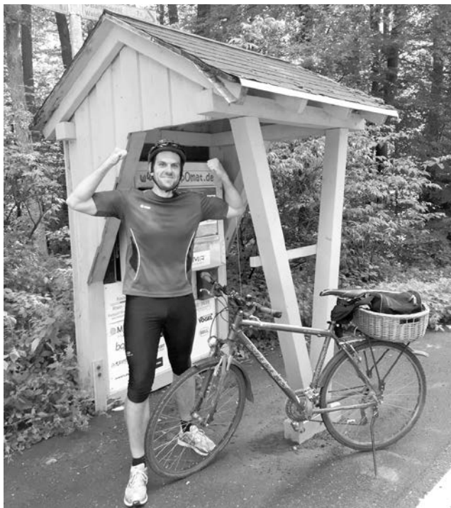
Der Stoppomat auf dem Heidelberger Königsstuhl ist beliebtes Ziel von Radsportlern, die Ihre Ausdauer auf den Prüfstand stellen

Nachdem ich meine Stempelkarte ausgefüllt und abgestempelt habe, kann es losgehen. Ca. 5 KM lang bergauf volles Rohr in die Pedale damit keine Zeit verloren wird. Schon schnell bemerke ich, der Königstuhl ist ein anderes Kaliber, als Kallenberg oder Galgenberg. Bei einer durchschnittlichen Steigung von 6,2% darf man eigentlich keinen Tritt auslassen. Nach einer gewissen Zeit wirkt diese Erkenntnis zermürbend auf mich. Die Laktatwerte schießen gefühlt nach oben und die Muskeln fangen an zu brennen. Hinter jeder Kurve erhofft man sich das Ziel vor Augen zu haben. Irgendwann passiere ich den alten Kohlhof. Das bedeutet das Schlimmste der insgesamt 320 Höhenmetern ist überwunden. Noch ein paar Minuten weiterstrampeln, dann ist es vollbracht. Nach ca. 30 Minuten „Höllennritt“ bin ich am Zielhäuschen angekommen und hole mir mit letzter Kraft den ersehnten Stempel. Der Stolz und der Adrenalinkick machen die gerade auf mich genommenen Strapazen schnell vergessen.