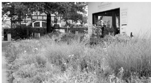
Vielfalt im Vorgarten bietet auch vielfältigen Lebensraum