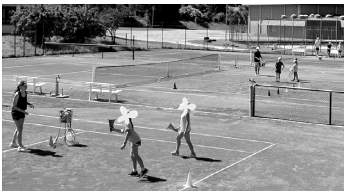
Das Fazit der Kinder war eindeutig - der Schnupperkurs hätte ruhig VIEL LÄNGER gehen können :)

Und wären das nicht schon genügend Termine und Ankündigungen im August, gibt es auch aus dem Jugendbereich noch Schönes zu berichten. Bereits am 11.08.2023 fand ein Schnupper-Tenniskurs auf der Anlage des TC Eschelbronn statt. Im Rahmen des Ferienprogramms haben 14 Kinder im Alter von 6-13 Jahren einen ersten Einblick in das Spiel mit der gelben Flitzkugel erhalten. Vom Tennisclub wurden hierfür alle erforderlichen Materialien und Trainer zur Verfügung gestellt. Für das leibliche Wohl der Kinder war auch wie immer gut gesorgt. Das Trainer-Team führte anfangs behutsam durch verschiedene Geschicklichkeits- und Koordinationsübungen an die Bewegungsabläufe des eigentlichen Tennisspiels heran. Als die Kinder sich mit Bällen und Tennisschlägern vertraut gemacht hatten, wurden die ersten richtigen Schläge, Vorhand und Rückhand ausprobiert. So manch einer konnte bereits nach wenigen Versuchen den Ball kontrolliert über das Netz ins gegenüberliegende Feld spielen und zeigte sich durchaus talentiert. Allzu schnell waren die Schnupperstunden wieder vorüber und die Kinder waren nach drei Stunden voller Spaß und Einsatzbereitschaft dennoch etwas enttäuscht, nicht noch viel, viel länger an ihrer Tenniskarriere zu feilen!