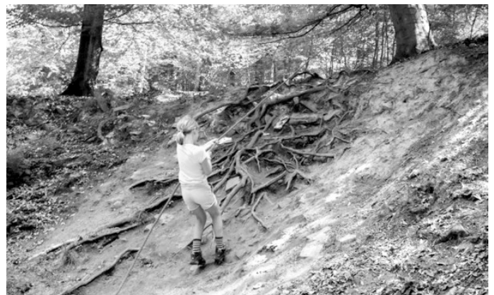
Viele Sinne braucht man beim Sinnenpfad im Neckargemünder Wald.

Noch mehr Freizeittipps gibt es auf dem Freizeitportal des Rhein-Neckar-Kreises unter www.deinefreizeit.com .