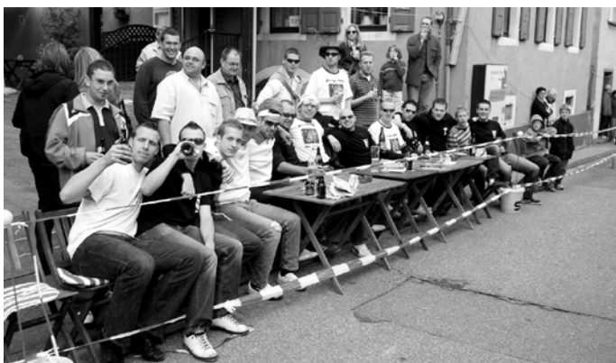
Eine große Fangemeinde verfolgte beim Gasthaus „Löwen“ den „1. Großen Preis vom Schreinerdorf“

21 Piloten gingen damals an den Start, die Strecke hatte eine Länge von 320 Metern bei einer Höhendifferenz von 20 Metern.