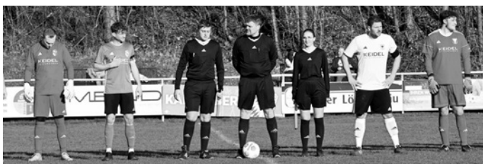
Beide Mannschaften liefen mit Trikots des „Hauptsponsors“ Keidel auf

Die Wahrheit liegt wie immer auf dem Platz.