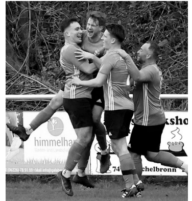
Der Jubel war groß und endlich in Führung