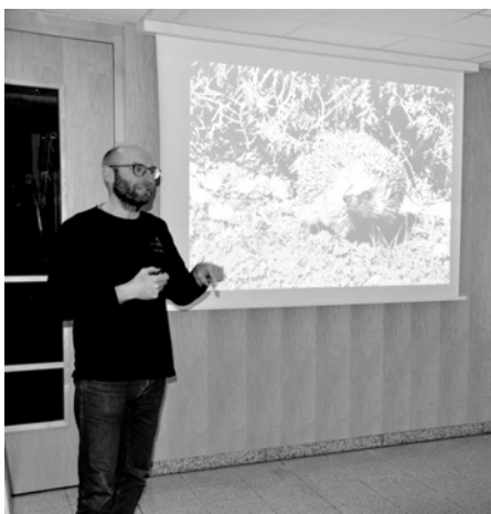
Der Vortrag „Naturnah gärtner – Artenvielfalt fördern“ stieß auf großes Interesse

Für den Referenten ist es ein Glück, wenn man einen Garten besitzt, in dem man gestalterisch tätig werden kann. Dieses hohe Gut solle man bewahren und in acht Schritten erklärte er, wie man einen naturnahen Garten entwickelt.