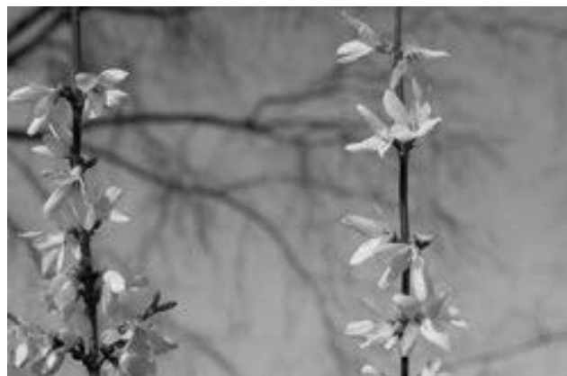
Die Forsythie blüht am einjährigen Trieb.