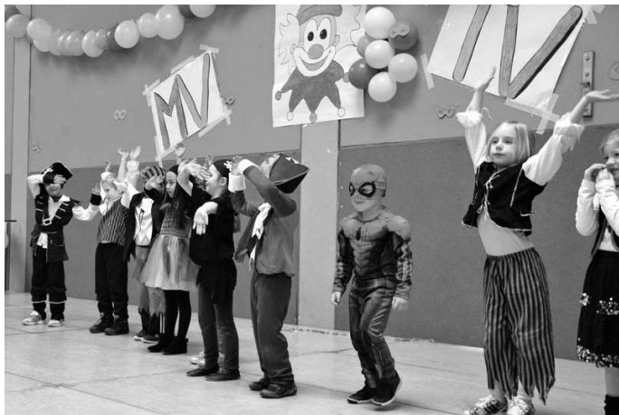
Die Tu-LeiKinder des TV beim Piratentanz

Besonders beliebt sind die Eltern-Kind-Spiele. In diesem Jahr sollten die Kinder ihre Eltern mit Toilettenpapier in Mumien verwandeln, was je nach Geschick mehr oder minder gut gelang.