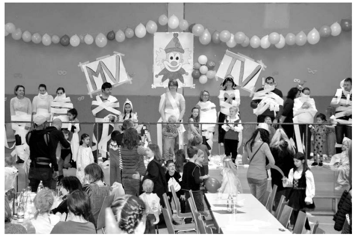
Die jungen Künstler präsentierten ihre „Mumien“

Der Turnverein und der Musikverein bedanken sich bei allen Helfern, die zum Gelingen der Veranstaltung beigetragen haben, besonders bei den Eltern, die spontan beim Aufräumen mithalfen.