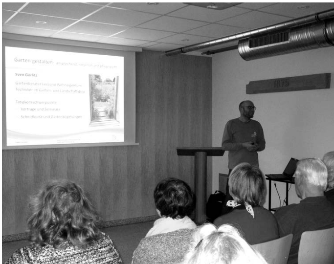
Aufmerksam verfolgten die Besucher den Vortrag des Gartenberaters.