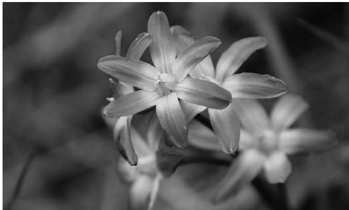
Schneeglantz oder Schneestolz (Chionodoxa luciliae) ist eine frühe Nahrungsquelle für Honigbienen und andere Insekten.

Zur weiteren Pflege des Staudenbeetes gehören das Auflockern der Erdkrume und das Verteilen von Komposterde zwischen den Pflanzen. Damit aktivieren Sie den Boden und versorgen die Stauden mit den notwendigen Nährstoffen.