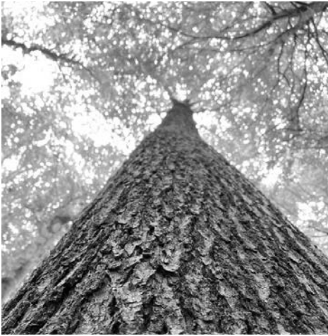
Blick in die grüne Krone der Eichen im Saatguterntebestand.