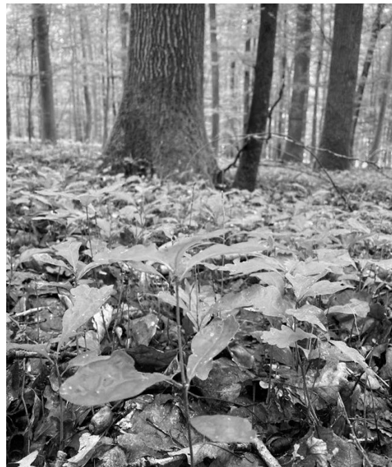
Junge Eichensämlinge – im Hintergrund eine der Eichen, von denen bald Saatgut im Stadtwald Sinsheim geerntet werden kann.