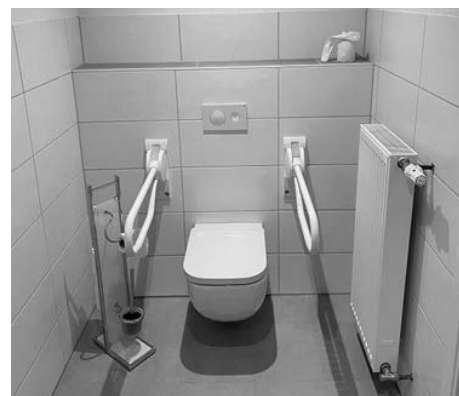
Behindertengerechte Sanitäranlage des FC Eschelbronn

Mit einem deftigen Weißwurstfrühstück wurden die neuen behindertengerechten Sanitäranlagen des FC Eschelbronn eingeweiht. Auch bewegungseingeschränkte Menschen können nun das Clubhaus besuchen. Der Einbau der neuen Sanitärobjekte ermöglicht den Zugang mit einem Rollator. Gefördert wurde dieses Vorhaben aus dem Regionalbudget, mit dem Vereine bei Investitionen zur Verbesserung von Angeboten unterstützt werden.