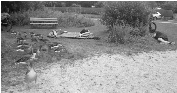
Kurz vor Hamburg ließen wir uns auch nicht vom Federvieh von unserem obligatorischen Nachmittags-Nickerchen abhalten

Vorbei an Hannover mit seinem Maschsee, quer durch die Lüneburger Heide nahte das „Tor zur Welt“ - nämlich Hamburg. Eine steife Brise wehte uns um die Nase, der Duft von frischen Fischbrötchen lag in der Luft und beeindruckend war die „Schiffwillkommensstelle“ in Hamburg-Wedel, wo ein riesiges Containerschiff nach dem anderen vorbei fuhr. Entsprechend der Nationalität der Schiffe erklang dann deren Nationalhymne. Das waren wirklich ergreifende Momente.