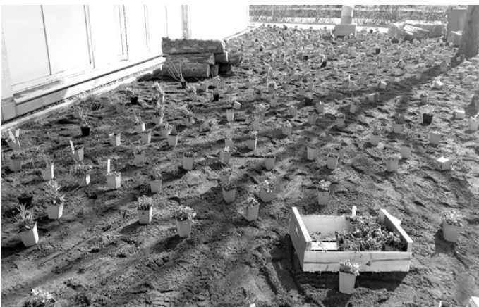
Auf den Flächen der Außenstelle des Landratsamts Rhein-Neckar-Kreis in Sinsheim wurden 540 Stauden gepflanzt

Auf den anderen beiden Flächen wurden zwei nährstoffarme Standorte für sogenannte Magerwiesen geschaffen. Ausgesät wurde anschließend heimisches, regio-zertifiziertes Saatgut. „Bis das Saatgut für die Magerwiesen anfängt zu keimen, wird es etwa acht Wochen dauern“, erklärt der Bauleiter der ausführenden Firma, Herr Wohlleben.