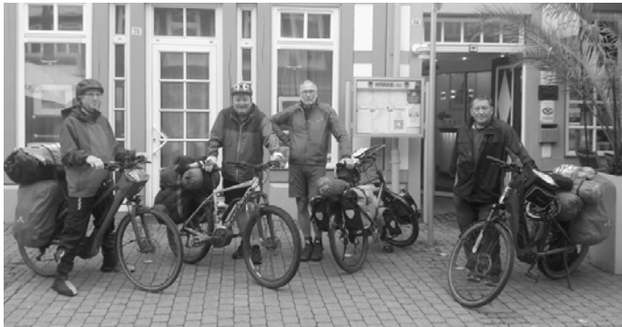
Voll bepackt durchquerten wir auf dem Sattel die schönsten Landstriche Deutschlands

Lediglich das Wetter war uns nicht immer hold, auf der Etappe rund um Göttingen regnete es ununterbrochen und wir wurden nass bis auf die Knochen. Daher gönnten wir uns in der folgenden Nacht ein kleines Hotelzimmer zum trocknen und aufwärmen.