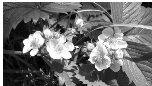
Für immertragende Erdbeeren, deren Erntezeit von Juni bis Oktober reicht, ist die Pflanzenzeit im April ideal.

Für wärmebedürftige Obstarten wie Brombeere, Fruchtfleige, Kiwi und Weinbeere, sowie Esskastanie und Walnuss ist die Pflanzenzeit optimal.