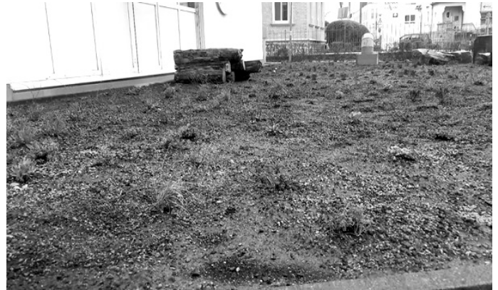
Ein Totholzhaufen wurde angelegt und die heimischen Stauden auf der vorbereiteten Fläche ausgelegt.

Schuler und Wohlleben sind sich einig: „Bis die unterschiedlichen Wildblumen auf den neu angelegten Blühwiesen ihre volle Pracht entfalten, wird es vermutlich bis zum kommenden Jahr dauern.“ Doch beide wissen auch: Die Geduld zahlt sich aus. Die Pflanzen benötigen diese Zeit, um sich vollständig entwickeln zu können. Ab dem kommenden Frühjahr werden sie jedes Jahr wichtige Nektar- und Pollenquellen sowie vielfältiger Lebensraum sein.