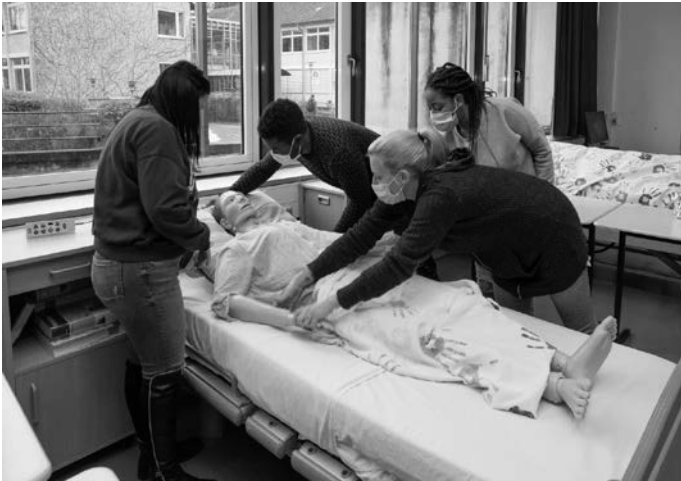
Auszubildenden der generalistischen Pflegeausbildung an der Albert-Schweitzer-Schule in Sinsheim, eine berufliche Schule in der Trägerschaft des Rhein-Neckar-Kreises.

Weitere Informationen erteilt der Ansprechpartner für die generalistische Pflegeausbildung im Landratsamt Rhein-Neckar-Kreis, Alexander Hack, E-Mail: a.hack@rhein-neckar-kreis.de . Infos gibt es auch unter www.rhein-neckar-kreis.de/pflegeausbildung .