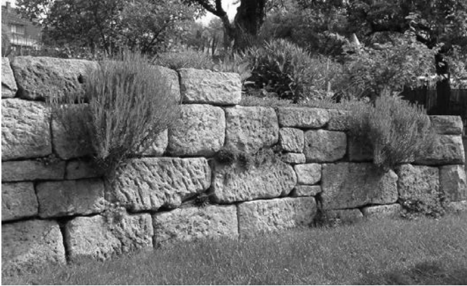
Trockenmauern sind einfach schön, oder?

Es können fast alle Steine für Trockenmauern verwendet werden. Wichtig ist ihre Haltbarkeit (Frost) und die Bearbeitbarkeit. Besonders schön sind Mauern aus bereits gebrauchten Sandsteinen, z.B. von Abbruchhäusern. Vorzuziehen sind Steine aus der näheren Umgebung.