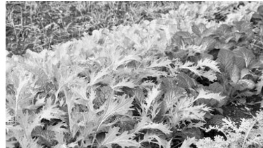
Asiagemüse oder Asiasalat sind schnell wachsende und für den ganzjährigen Anbau geeignete Blattsenf-Arten.

Wärmeliebendes Gemüse im September abernten. Herbstgemüse braucht noch etwas Dünger. Um die Gefahr der gefräßigen Raupen des Kohlweißlings umweltverträglich einzudämmen, hilft Absammeln. Diese Aussaaten und Pflänzchen können noch in die Erde.