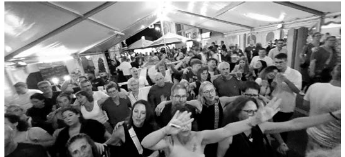
Im prall gefüllten Feuerwehrzelt wurde bei „Gonzo`s Jam“ mächtig abgetanzt

Was die Feuerwehr nachts dann in und vor der Fahrzeughalle auf die Beine stellte, das ließ die Stimmung auch am zweiten Kerwetag regelrecht explodieren.