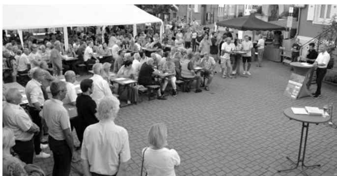
Das neue großzügige Platzangebot hat sich bewährt