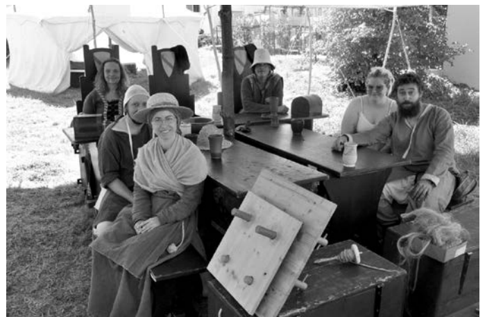
Die „Freien Badener“ bringt so schnell nichts aus der Ruhe, sie genießen das Leben in ihrem Camp auf der alten Schulwiese

Auf dem von Martin Räßle organisierten Flohmarkt auf der Bahnhofstrasse, Oberstrasse und Kandelstraße konnten alle nützlichen Dinge des Alltags erworben werden, die man schon lange gesucht und nie gefunden hat.