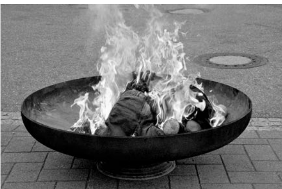
Das war das Ende einer unvergesslichen Eschelbronner Kerwe.

Die Bierstandbrigade, in anderen Ortschaften heißen sie Kerwepörscht, stürmten den Rathausbalkon und schwenkten feuerrote Bengalos herunter.