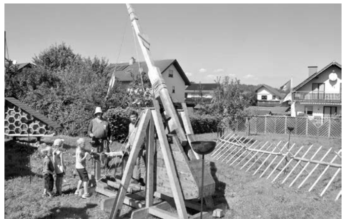
Der Tribock der Mittelaltergruppe „Freie Badener“ war die Attraktion besonders bei den jungen Kerwebesuchern.

Draußen ließen es sich die „Freien Badener“ auf ihrem Camp gut gehen und demonstrierten den Tribock, der besonders bei den Kindern auf großes Interesse stieß.