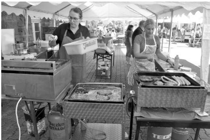
Viel zu tun hatte das Küchenteam, wo Schnitzel, Kraut, Sooß und Bratwurst zubereitet wurden

So konnte wieder eine gemeinschaftliche Veranstaltung von Musikverein und Heimat- und Verkehrsverein erfolgreich durchgeführt werden.