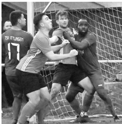
Manch Spieler war froh mit intaktem Trikot die Szene zu überstehen

Das Spiel wurde härter und umkämpfter und beide Teams hatten richtig Sehnsucht nach 3 Punkten.