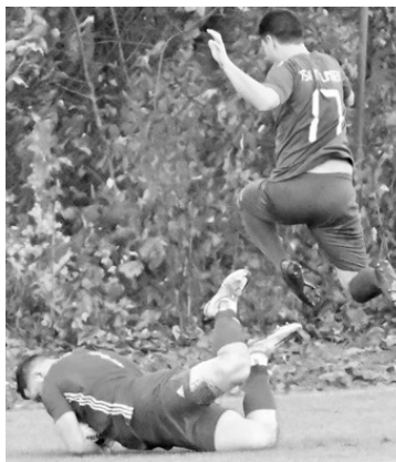
Ansonsten hielt Justus, wie üblich, das Ergebnis fest

Das kann aber kein Grund für die nachlassende Leistung gewesen sein. In der 74. Minute dann das 2 : 1 – auch hier war der Ball nicht unhaltbar – sorry Justus.