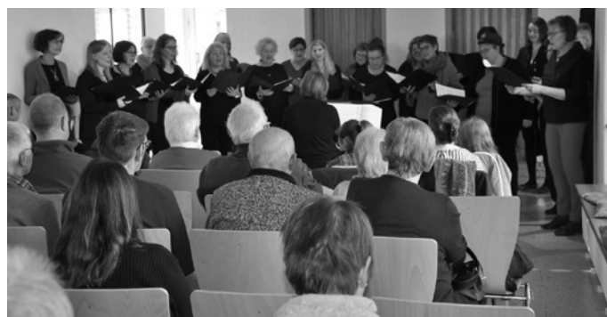
Ein neues musikalisches Wagnis war für „Vocalis“ ihr erstes Chor-Matinee - es hat sich gelohnt und war ein voller Erfolg

„God rest ye marry Gentleman“ erinnert daran, dass Weihnachten eine Zeit der Freude, des Trostes und der Zusammengehörigkeit ist. Das keltische Weihnachtslied „A Celtic Christmas“ vermittelt eine Stille im Trubel der Weihnachtszeit und soll ein Gespür für das Wesentliche schärfen, während „Mary did you know“ das Erstaunen und die Bewunderung für Jesus und sein Wirken ausdrückt.