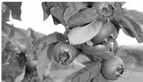
Die Mispel ( Mespilus germanica ) ist ein kleinwüchsiger Obstbaum mit großem Zierwert.

Denkt bereits jetzt an die nächste Gartensaison. Mit vorbeugenden Pflanzenschutzmaßnahmen könnt ihr effektiv Pilzkrankheiten und Schädlingsbefall eindämmen.