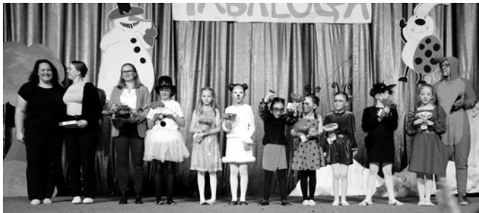
Die Darsteller erhielten ein kleines Präsent für ihre schauspielerischen Leistungen.

Ein besonderer Dank ging an die über 50 ehrenamtlichen Übungsleiter und Helfer in den verschiedenen Abteilungen des Vereins. Sie wurden auf der Bühne vorgestellt und erhielten ein kleines Präsent.