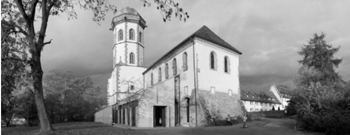
Hochkarätige Klaviermusik in historischem Ambiente: Die Sunnisheimer Klaviertage in der Stiftskirche Sunnisheim in Sinsheim.

Sofern am Veranstaltungstag noch Karten vorhanden sind, wird es auch eine Abendkasse geben. Alle weiteren Infos unter: www.kultur-im-kreis.net