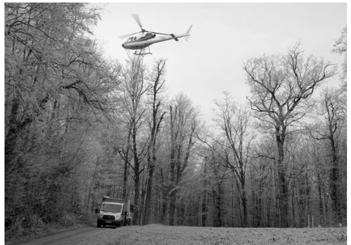
Hilfe für den Wald im Klimawandel: Im Kleinen Odenwald wird die Bodenschutzkalkung per Helikopter fortgesetzt.

Weitere Infos zum Thema Bodenschutzkalkung finden sich auf der Internetseite der Forstlichen Versuchsanstalt: www.fva-bw.de/themen/waldboden