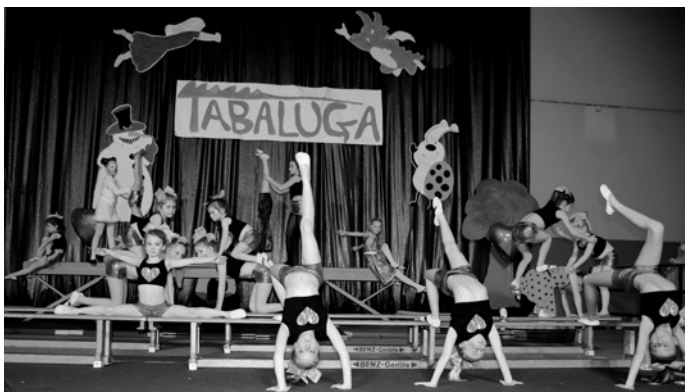
Die Leistungsgruppe der Mädchen überzeugten am Schwebebalken