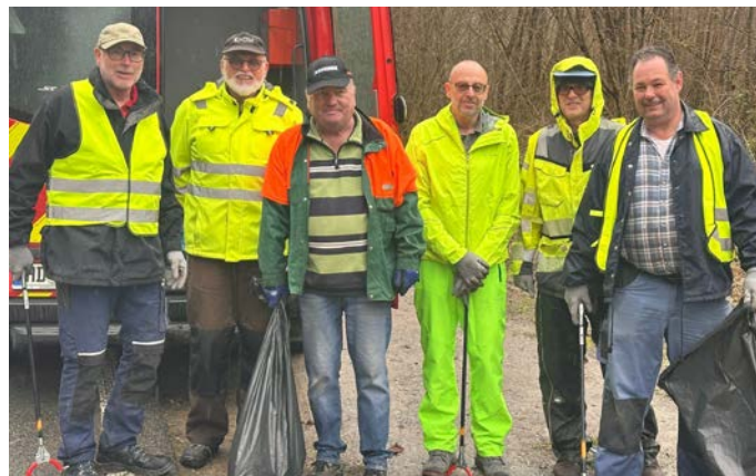
6 HVVE-Müllsammler beteiligten sich am „Frühjahrsputz“ der Gemeinde

Nach dreistündiger Arbeit kamen alle Einsatzkräfte wohlbehalten an den Treffpunkt zurück, wo man sich beim Imbiss und Umtrunk wieder etwas stärken konnte.