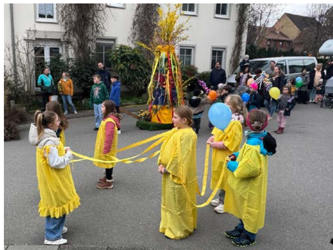
Sommer und Winter (im Hintergrund) wurden von den „Sonnenmädchen“ begleitet. Für den Winter sollte es sein letzter und beschwerlicher Gang sein.

Wie immer ging der Winter bei der Sporthalle schnell in lodernde Flammen auf, nachdem das Streichholz an ihm angesetzt war.