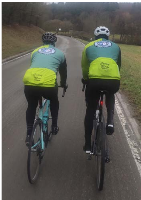
Der Club Cycliste 2024 Eschelbronn e.V. auch bei kalten Temperaturen im einheitlichen Gewand

Nachdem unser Sommeroutfit bereits großen Anklang gefunden hat und den Verein sichtbar macht, steht den Mitgliedern, die auch im Winter trainieren, nun auch Winterbekleidung in den Vereinsfarben zur Verfügung.