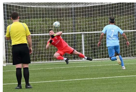
Wieder eine tolle Parade

Auch nach dem Seitenwechsel setzte sich der Spielverlauf ähnlich fort. Der FC kam nun häufiger zu eigenen Chancen, konnte diese jedoch nicht verwerten.