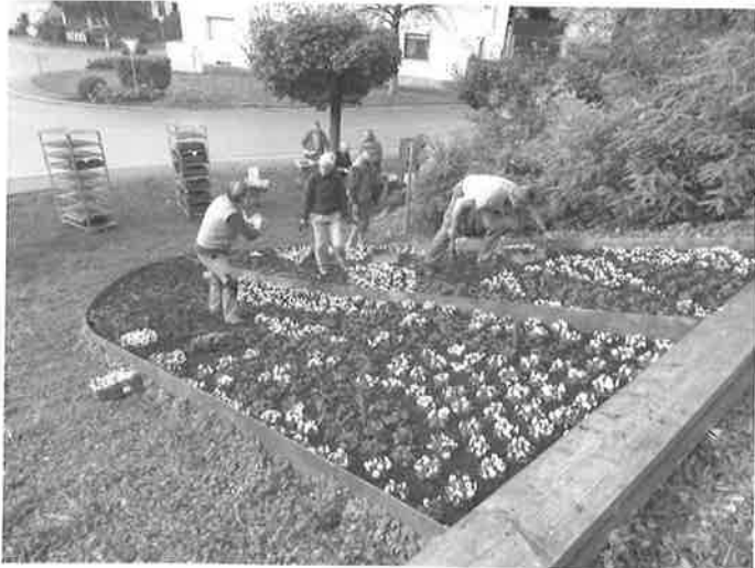
Farbenfroh wird das Blumenwappen für den Herbst und Winter neu bepflanzt.

Für die Siedlergemeinschaft Eschelbronn bedeutet die Herbstzeit wieder einmal Pflanzzeit für das Blumenwappen an der Bahnhofstraße/Industriestraße. Seit dreißig Jahren, anlässlich der 1200 Jahr Feier von Eschelbronn im Jahre 1989, fördert sie maßgeblich die Anlage und Gestaltung des Blumenwappens als wichtigen Beitrag zur Ortsverschönerung. Im Frühling und Herbst ruft sie Mitglieder und freiwillige Helfer zum Arbeitseinsatz für die Neubepflanzung auf. Rund 1000 Stiefmütterchen in den Farben rot, blau und weiß standen nun bereit, um von den Helfern in der Form des Eschelbronner Wappens aus Rauten und Lilien gepflanzt zu werden. Bürgermeister Marco Siesing wünschte gutes Gelingen und kündigte für nach getaner Arbeit ein gutes Vesper an. Die Gemeinde übernimmt ebenso die Kosten für die Blumen. Dank der Arbeitsteilung unter den Helfern - die einen wässerten die Pflanzen, andere setzten sie in die Erde - konnte die Arbeit zügig erledigt und nach rund drei Stunden zufrieden betrachtet werden. Tage zuvor hatten Kinder des örtlichen Kindergartens „Die Holzwürmer“ bereits großen Spaß, als sie mitgewirkt haben, die bisherigen Blumen abzuräumen. (Text: Marika Gutschik-Schilling) (Bild: Siedlergemeinschaft Eschelbronn).