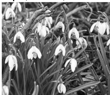
Schneeglöckchen ( Galanthus nivalis )

Die Hauptpflanzzeit für die im Frühjahr blühenden Zwiebel- und Knollengewächse ist im September und Oktober . Tulpen, Narzissen, Zierlauch und Krokus können notfalls auch noch bis Ende Dezember gepflanzt werden, sie blühen dann nur etwas später. Für die sehr frühblühenden Arten (z.B. Schneeglöckchen, Märzenbecher,