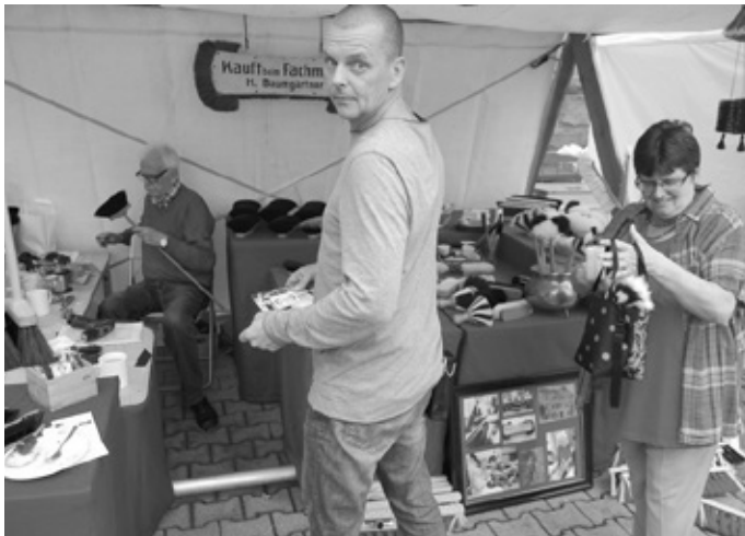
Die Bürstenmacher aus Bad Friedrichshall machten so manche Hausfrau mit einer neuen Bürste glücklich

Aber man war gewappnet, unter den unzähligen Zeltdächern ließ man sich die Stimmung nicht verderben. Die Künstler und Handwerker, die ihre Arbeiten vorstellten, sind ja einiges gewohnt.