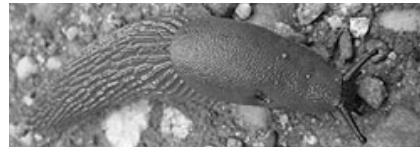
Nacktschnecke - Unbeliebter Gartenbewohner

Nacktschnecken gehören sicherlich zu den unbeliebten Gartenbewohnern. Bei allem Ärger sollte man aber nicht vergessen, dass auch die Schnecken in unserem Ökosystem eine wichtige Aufgabe wahrnehmen. Sie zerkleinern organisches Material, wirken somit an der Entstehung von Humus mit und sind eine wichtige Nahrungsquelle für viele andere Tierarten. Kommt es jedoch zu einer Massenvermehrung von Nacktschnecken, muss der Gärtner etwas unternehmen.