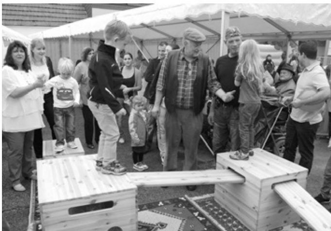
Einen hölzernen „Zauberwürfel“ stiftete die Holzabteilung der Sinsheimer Friedrich-Hecker-Schule dem Kindergarten, die Kinder freuten sich

Ebenfalls im Trockenen saßen die Musikvereine aus Eschelbronn und Friolzheim, die zur Unterhaltung aufspielten. Hüpfburg, Ponyreiten, Kinderschminken und Luftballon-Wettbewerb machte den kleinen Kerwebesuchern Spaß und von der Holzabteilung der Sinsheimer Friedrich-Hecker-Schule gab es für den Kindergarten einen „Zauberwürfel“ aus Massivholz mit allerlei Nutzungsmöglichkeiten. Die Kinder und Erzieherinnen dankten es dem Spender artig mit einem Liedchen.