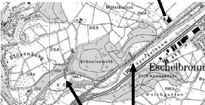
Bereich der Pflegemaßnahmen

Durch diese Pflegearbeiten wird ein aktiver Beitrag zur Versicherung getroffen und wir danken bereits jetzt für das Verständnis aller Betroffenen.