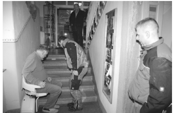
Bild: Der neue Treppenlift sorgt dafür, dass künftig auch gehbehinderte Menschen das Museum leicht erreichen können. Die Einweisung wurde von den Firmentechnikern vorgenommen

Jetzt ist das Schreiner- und Heimatmuseum auch für gehbehinderte Besucher barrierefrei leicht zu erreichen. Die sechs Stufen vom Eingangsbereich hinein ins Museum können mit einem etwas über zwei Meter langen Treppenlift überbrückt werden, der in diesem Tagen von der Firma Matthias Pfau aus Römerberg bei Speyer eingebaut wurde. Mit einer Geschwindigkeit von 10 Zentimetern in der Sekunde wird man batteriebetrieben in die entsprechende Höhe befördert, die Tragkraft beträgt 125 Kilogramm. Mit einer Fernbedienung ist die Einrichtung leicht zu steuern und umfangreiche Sicherungseinrichtungen sorgen dafür, dass während der Fahrt nichts passiert.