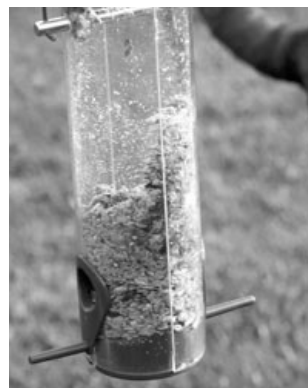
Bei diesem Futtersilo hat das Vogelfutter deutliche Schimmelspuren.

Für die Winterfütterung unserer gefiederten Freunde haben sich sogenannte Futtersilos durchaus bewährt. Doch ist hier Vorsicht geboten, denn nicht jedes Futtersilo ist wirklich geeignet. Silos, die aus einer komplett geschlossenen Röhre bestehen, sind zu bevorzugen. Im Handel erhält man oft preiswertere Produkte, die sich aus zwei Hälften zusammensetzen. Diese sind aber in der Regel völlig ungeeignet, da Feuchtigkeit ins Futter eindringen kann. Bei milderer Witterung beginnt dann das Futter zu schimmeln. So schadet man den Vögeln mehr, als man ihnen hilft!