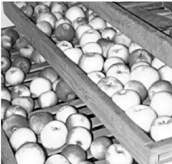
Apfellager in flachen Obststeigen

Diese Fäule wird durch unterschiedliche Schaderreger hervorgerufen. Oft wird die Lagerfäule gleichzeitig durch mehrere unterschiedliche Pilze verursacht. Unterschieden wird in Kernhaus-, Grün-, Schwarz-, Bitter- oder Lentizellenfäule.