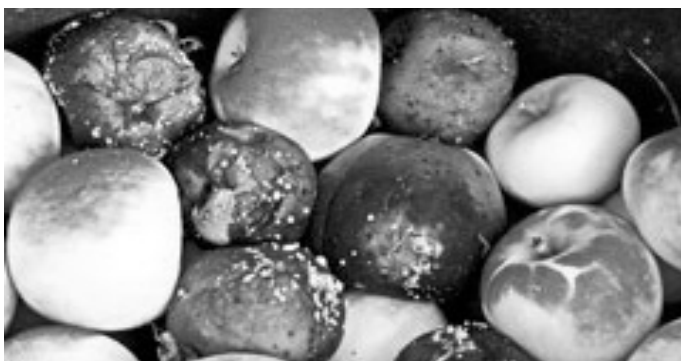
Verschiedene Lagerfäulen mit Monilia