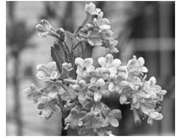
Viburnum bodnantense „Dawn“

Ein Garten muss im Winter nicht trostlos erscheinen, wenn er bei der Pflanzenauswahl richtig durchdacht wird. Nicht die „Immergrünen“, wie viele Gartenbesitzer meinen, erfüllen den Garten im Winter mit Leben, sondern es sind die „Laubabwerfenden“, die in dieser Zeit zur Blüte kommen.