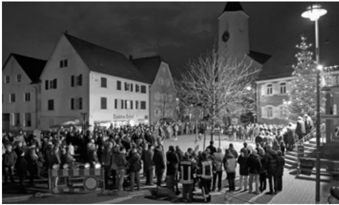
Für weihnachtliche Stimmung auf dem Marktplatz sorgten alle singenden und musizierenden Vereine mit ihren Darbietungen

und vom Musikverein. Zum Schluss sang der ganze Marktplatz wieder zusammen „Oh du fröhliche“.