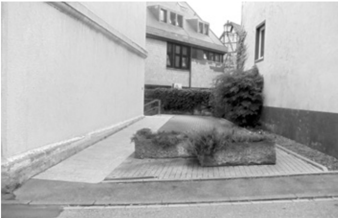
Zukünftiger Standort des Schwerbehindertenparkplatzes

amt beim Landratsamt Rhein-Neckar-Kreis einen allgemeinen Schwerbehindertenparkplatz in der Ortsmitte von Eschelbronn angeordnet hat. Der Bauhof ist aktuell mit der Herstellung des Parkplatzes betraut, dazu werden die Pflanzkübel umgesetzt und eine entsprechende Beschilderung angebracht.