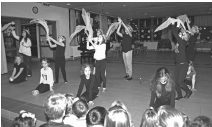
Die Tanz-AG der 3. und 4. Klasse führte den „Weihnachtstanz“ auf

Nach dem Weihnachtstanz der Tanz-AG der Klassen 3 und 4 erzählte die 3. Klasse die Weihnachtsgeschichte. „Die große Verwirrung“ hieß das Stück, die aber im Lauf der Erzählung aufgelöst werden konnte.