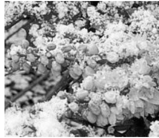
Mahonia bealei „Winter Sun“