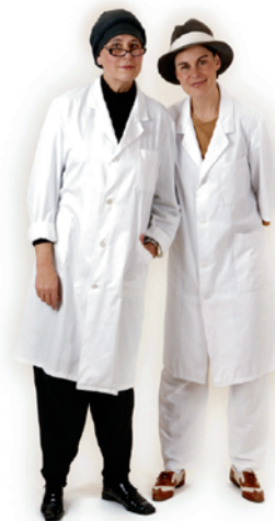
TheaterDuo Greiner & Hilsenbek www.das-theatermobil.de