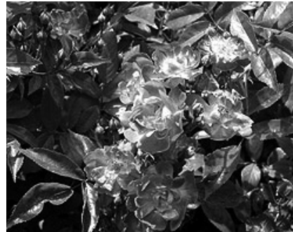
Kletterrose „Veilchenblau“ (Ramblertyp)

Rosen sollten jetzt noch nicht geschnitten werden, auch dann nicht, wenn wir frostfreies, mildes Wetter haben. Warten Sie mit dem Schneiden bis Ende März / Anfang April , selbst wenn die Pflanzen dann bereits ausgetrieben haben.