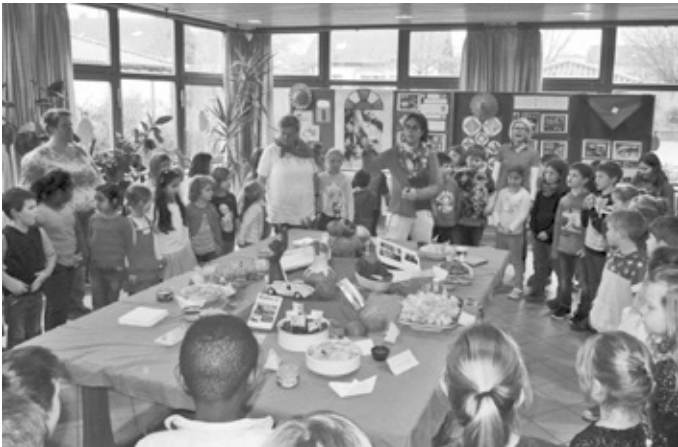
Zum Abschluss ließen sich Schüler und Lehrer landestypische Köstlichkeiten aus Kuba schmecken.