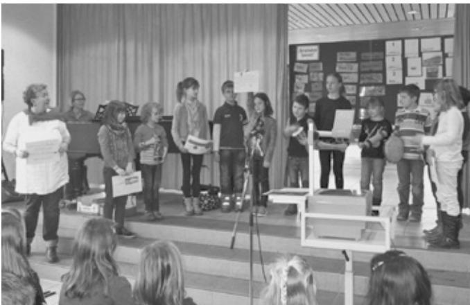
Schüler der Schlosswiesenschule präsentieren im Gottesdienst, was sie über Kuba gelernt haben.