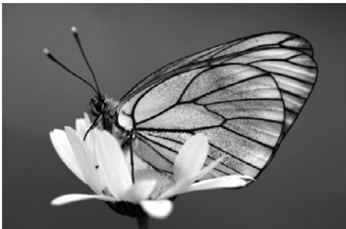
Bild: Der Baumweißling mit seinen weißen Flügelflächen und schwarz gefärbten Adern erreicht eine Flügelspannbreite bis zu 80 Millimeter

Er renne den Schmetterlingen nicht hinterher, wie er sagt, sondern er wartet an bestimmten Stellen auf sie, wo er genau weiß, dass sie kommen werden. Das kann manchmal dauern, aber mit einer gehörigen Portion Geduld ist der Photograph gut ausgestattet.