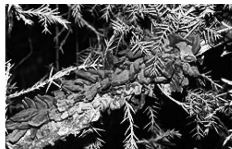
Schadbild der Krankheit an Wacholder (mit austretenden Sporen)