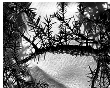
Schadbild der Krankheit an Wacholder