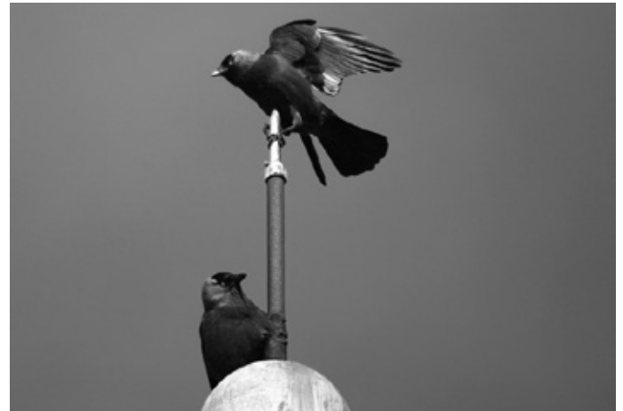
Bild: Die Dohle hat sich den Brutplatz auf dem Dach der alten Schule gegen den Turmfalken erkämpft

Am Ende seiner Ausführungen zeigte Michael Auer noch Bilder eines erbitterten Luftkampfes um den begehrten Brutplatz auf dem Turm der alten Schule zwischen dem Turmfalken und der Dohle. Anscheinend haben sie die Schleiereule, die in den vergangenen Jahren dort oben Stammgast war, inzwischen etwas verdrängt. Den Kampf konnte am Ende die Dohle für sich entscheiden.