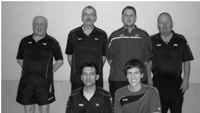
Vizemeister der Kreisklasse D, Staffel 2 wurde die 2. Mannschaft des TTV Eschelbronn