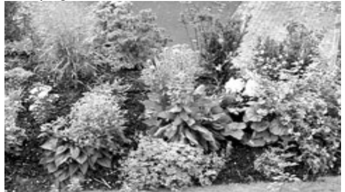
Staudenbeet mit Rindenmulch.

Das Bedecken der Bodenoberfläche mit Mulch-Materialien hat sich bisher wenig bei den Gartenfreunden durchgesetzt. Oft liegt es daran, dass die wichtigen Funktionen und die Vorteile des Mulchens nicht erkannt werden. In vielen Fällen wird aber auch mit Mulchen das Abdecken der Beete mit geschreddertem Holz assoziiert. Und das empfinden viele Gartenfreunde als hässlich.