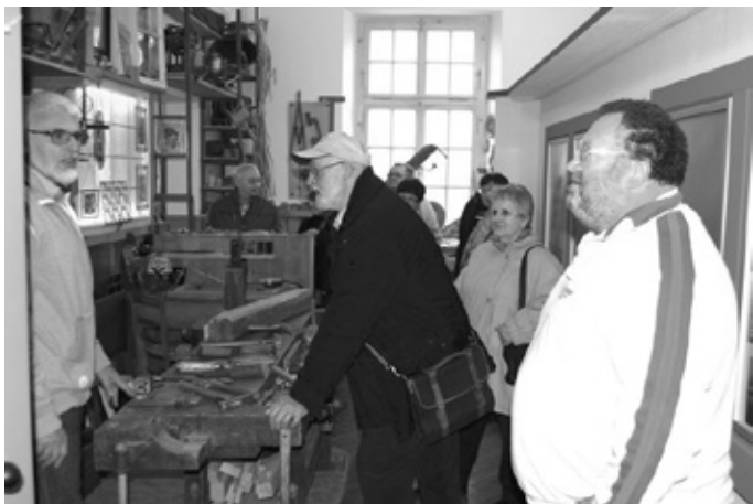
Bild: Gut besucht war das Schreiner- und Heimatmuseum an den vergangenen Sonntagen

Am Konfirmationssonntag waren es Freunde, Verwandte und Bekannte der Konfirmanden, die einen Abstecher zu uns gemacht haben. Am verkaufsoffenen Sonntag kamen viele Besucher von auswärts, die nach dem Besuch der Möbelhäuser einen Blick ins Museum geworfen haben.