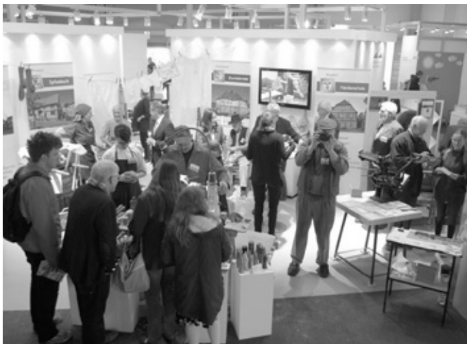
Museen aus Epfenbach, Eschelbronn, Neidenstein und Meckesheim sind wieder mit vollem Einsatz auf dem Maimarkt.

Sowohl in Epfenbach, Eschelbronn, Meckesheim und Neidenstein beherbergen die Museen für die Darstellung historischer Geschichten und um sie der Nachwelt zu erhalten, umfangreiche Exponate, zeittypische Werkzeuge, Gerätschaften und allgemeine Dinge des täglichen Lebens. Es ist die mittlerweile fünfte gemeinsame Maimarktteilnahme. In den Jahren zuvor wurde mit Drechseln, Sense dengen, Heurechen fertigen, Malerarbeiten mit längst vergessenen Techniken, Schusterarbeiten, mit der Arbeit der Waschweiber oder der Präsentation eines Firsörladens für große Aufmerksamkeit gesorgt.