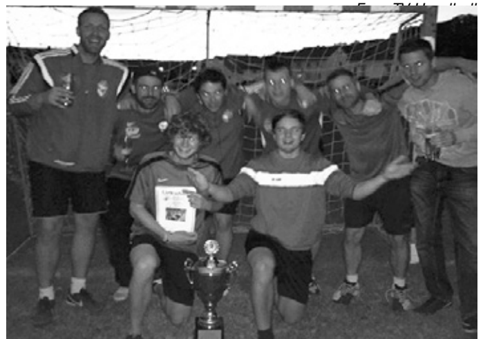
(Die letztjährige Siegermannschaft des FCE)

Nähere Infos (Anmeldebogen, Satzung...) unter handball-eschelbronn.de ! Spielt mit oder kommt vorbei zum Zuschauen und Anfeuern! Für Essen und Trinken ist bestens gesorgt! Wir freuen uns auf eurer Kommen!