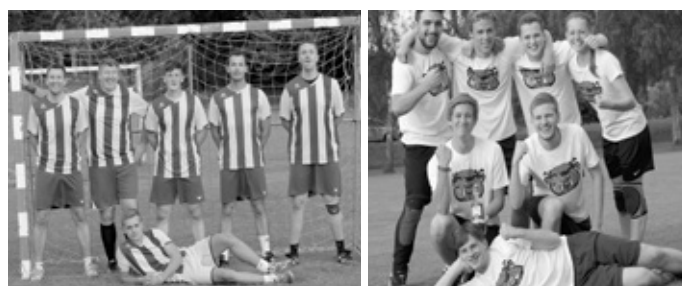
(Die letztjährigen Teams BSV Meschelbronn und Kameltreiber)

Spielt mit oder kommt vorbei zum Zuschauen und Anfeuern! Für Essen und Trinken ist bestens gesorgt! Wir freuen uns auf eurer Kommen! Euer TV Handball