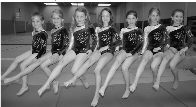
Mit den Disziplinen Sprung, Balken, Boden, Trampolin und einem 50 m Lauf wollten die Mädchen Punkten.

Sichtlich nervös ging die kleine Gruppe an den Start. Alles war neu und unsere Halle war voller Turnkinder .Logisch gab es da viel zu sehen und zu bestaunen. Sammeln und ruhig bleiben hieß nun die Devise. Nach dem Warm-Up und Einturnen startete pünktlich um neun der Wettkampf.