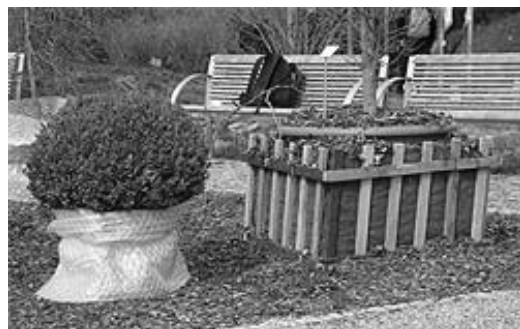
Winterschutz durch Folie und Laub