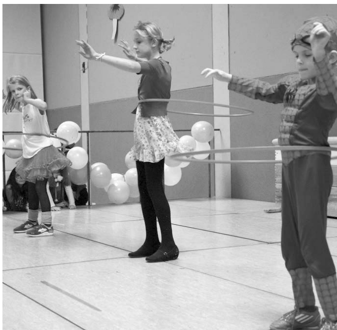
Spannend war der Hula-Hoop-Wettbewerb,

Die 500 Luftballons, mit denen die Halle geschmückt war, waren bei den Kindern sehr begehrt und fanden sehr schnell ihre Besitzer.