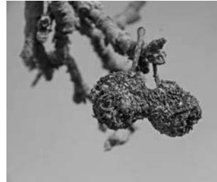
Fruchtmumien an einem Apfelbaum

Fruchtmumien entfernen Krankheiten vorbeugen