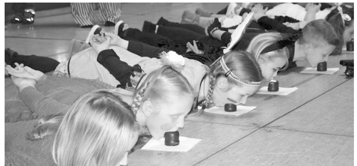
Mohrenkopf-Essen machte Spass