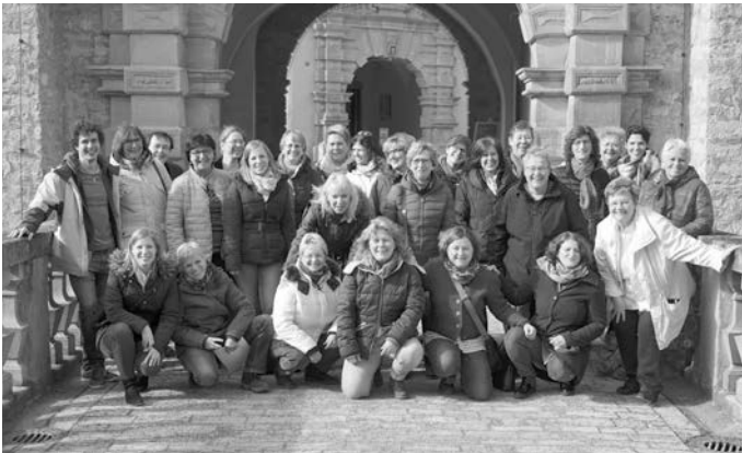
(Probenwochenende Frauenchor „Vocalis“ in Weikersheim; Februar 2017)

Sonntag, den 19. März um 17 Uhr in der Katholischen Kirche in Eschelbronn