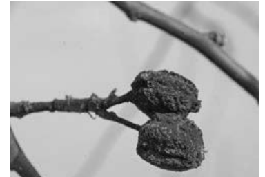
Pflaume mit Fruchtmumie