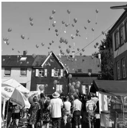
Um 14 Uhr werden wieder viele bunte Luftballons anlässlich des Luftballon-Weitflugwettbewerbs in den Himmel über dem Museum steigen

Viele bunte Luftballons werden am Nachmittag beim Luftballon-Wettbewerb in den Himmel steigen und als weitere Attraktion für die kleinen Kerwebesucher stehen Ponys auf der Wiese bereit, und freuen sich, mit den Kindern ein paar Runden zu drehen.