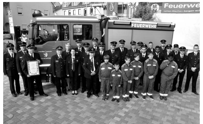
Bild: Die Eschelbronner Wehrleute sind stolz auf ihr neues Löschfahrzeug, mit dem nun eine bessere und effizientere Hilfe möglich ist

Der Bürgermeister erinnerte daran, dass Ausschreibung und Beschaffung durch einen eigens gegründeten „Beschaffungsausschuss“ problemlos über die Bühne ging und auch die Zuschüsse in Rekordzeit gewährt wurden. Die gemeinsame Abholung des Fahrzeugs im Teutoburger Wald war für ihn ein besonderes Erlebnis und schaffte ein neues Zusammengehörigkeitsgefühl.