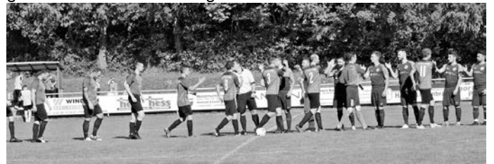
Beim Einlauf war noch alles gut

Bestes Fußballwetter - Besucher / Zuschauer soweit das Auge reicht und es war Kerwe. Mit guten Vorsätzen ging es in das Match. Es stellte sich aber recht zügig heraus - Gemmingen war ein sehr starker Gegner.