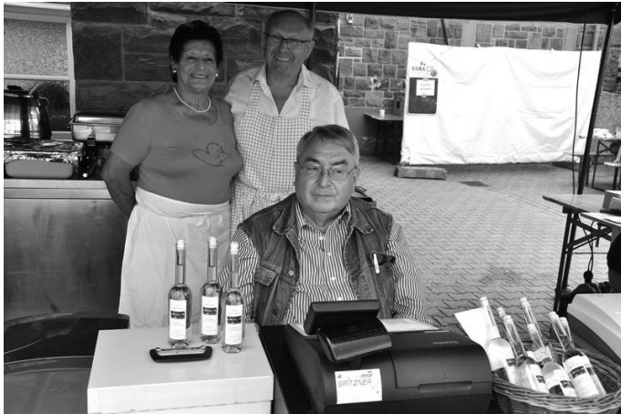
So sieht die „Ruhe vor dem Sturm“ aus: Entspannte Gesichter noch bei den Helfern in Küche und an der Kasse

Ein Renner ist und bleibt das Frühstücksvesper mit Wurstsalat und bayrischen Schmankerln wie Obatzter und Weisswürsten. Da waren die Vorräte schnell aufgebraucht, aber es galt die Devise: „Was weg ist, ist weg!“ Das gilt auch für den Meerrettich mit Tafelspitz, nicht wenige Kerwebesucher sind wegen dieser Delikatesse von weit her angereist. Für den „Süßen“ gab es Crepes in vielen Variationen, Kaffee, Torten und Kuchen in grosser Auswahl.