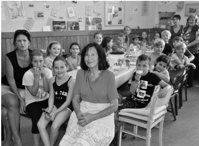
Groß war der Appetit bei den Teilnehmern des Sellemols-Ferienprogramms

Als alles soweit fertig war, um in Pfanne und Backofen zu landen, starteten die Kinder noch auf eine Schnitzeljagd durch das Dorf, wo ziemlich knifflige Fragen beantwortet werden mussten. Dann zog auch bald schon der Duft aus dem alten Schulhaus durch die Eschelbronner Strassen, von dem die Kinder regelrecht angezogen wurden. Durstig und hungrig versammelte man sich am großen Tisch und es schmeckte jedem so richtig gut.