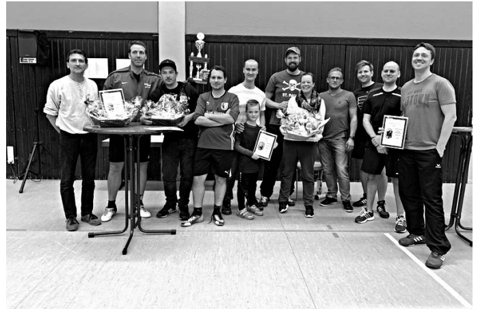
Die siegreichen Mannschaften des Tischtennis-Turniers bei der Siegerehrung

An der Tischtennisplatte setzten sich die Noppenbomber vor der Mannschaft BDT und der Sachsenpower durch. Letztere sind schon seit vielen Jahren Stammgäste beim Eschelbronner Turnier.