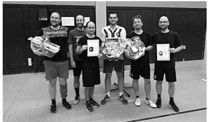
Familiär waren die Mannschaften des Badminton-Turniers zusammengestellt