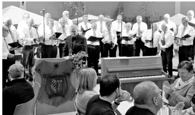
Viel Applaus erhielt der Männerchor für seinen Auftritt bei der Jahresfeier der Lyra.

cula-Rock“. Der kurzweilige Nachmittag verging bei Kaffee und Kuchen, mit Ehrungen (siehe separater Bericht) und mit weiteren Auftritten der Chöre. Traditionelle Lieder, Volkslieder, Lieder der Rock- und Popgeschichte waren zu hören. Zum Abschluss stimmte das Publikum in „Bunt sind schon die Wälder“ ein. Gerne nutzte es die Gelegenheit, um ausgiebig an den Marktständen zu flanieren und nach Herzenslust bei den Hobby-Künstlern und Kunsthandwerkern einzukaufen. Seidentücher, Tiffanyglaskunst, selbstgemachte Marmeladen, Gelees, Liköre, handgefertigte Seifen, kunstvolle Papiersterne, Magnetschmuck, Advents- und Weihnachtsdekorationen wurden angeboten. Eine Tombola war reich bestückt und Kinder verweilten sich am Basteltisch und bastelten Tischlaternen.