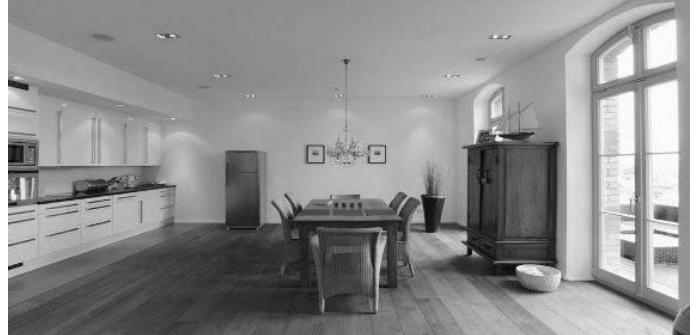
Ein Raum ist behaglich, wenn die mittlere Temperatur der Wände maximal drei Grad unter der Raumlufttemperatur liegt.

Die niedrigen Oberflächentemperaturen sind sehr oft die Ursache für einen eventuellen Feuchtigkeitsniederschlag (Tauwasserbildung) und die damit verbundene Schimmelbildung an den Wänden. Diese Erscheinungen treten vornehmlich in den Ecken, aber auch hinter Möbeln auf, da dort die Oberflächentemperatur besonders niedrig ist und dort kaum eine Luftzirkulation stattfindet. Mit einer fachmännisch angebrachten, richtig dimensionierten Wärmedämmung passiert das nicht.