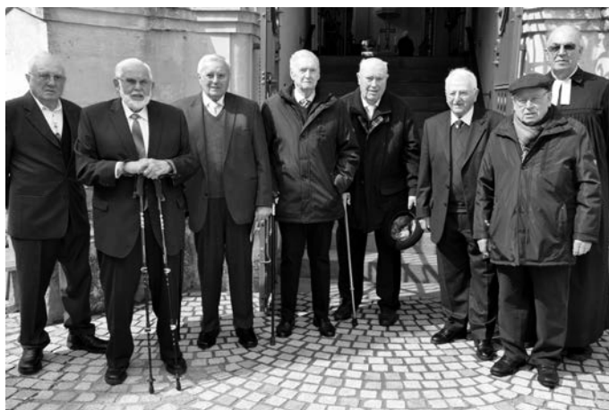
Vor 70 Jahren wurden die Jubilare der „Gnadekonfirmation“ von Pfarrer Vollhardt konfirmiert

Mit dem gemeinsamen Abendmahl klang der Festgottesdienst aus und draussen auf der Rathaustreppe traf man sich zu einem Erinnerungsbild.