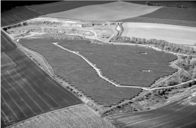
Zur Förderung regenerativer Energien mit dem Ziel eines energieautarken Landkreises hat der Kreistag auch Gesellschaftsanteile an der Solarpark Lobbach 1 GmbH & Co. KG erworben.

„Partner mit der Auszeichnung Silber“ gekürt worden ist, soll nun der Weg zum Gold gemeinsam mit den Gemeinden weitergegangen werden. Was im Kreis oder einer Kommune geplant wird, soll künftig noch stärker auf seine Potentiale für einen nachhaltigen Klimaschutz untersucht und in Auswahl, Priorisierung und Umsetzung bewertet werden, was eine Auswahl konkreter Maßnahmen durch die Entscheidungsträger erleichtern kann.