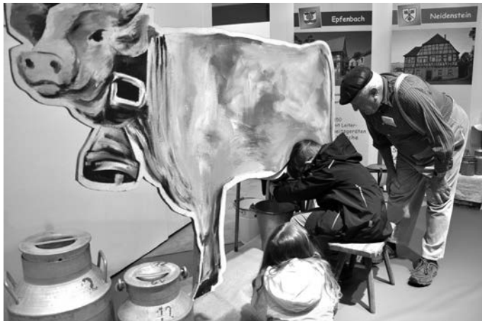
An einer Holzkuh konnte sich der städtische Mai-Markt-Besucher mehr oder weniger erfolgreich am Melken üben.