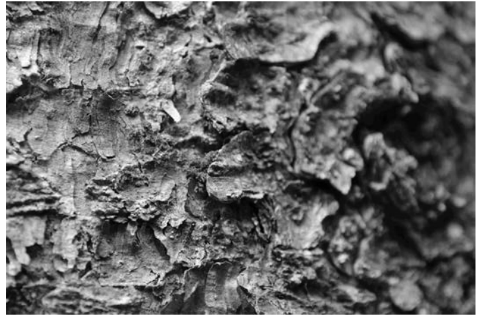
Das braune Bohrmehl auf der Rinde, unter Rindenschuppen, auf Spinnweben und am Stammfuß ist ein eindeutiges Zeichen für den Borkenkäferbefall.

Sind befallene Bäume ausgemacht, ist sofortiges Eingreifen vonnöten: das Holz einschlagen oder einschlagen lassen und schnell aus dem Wald bringen! Gelingt dies nicht, müssen die Stämme entrindet oder gehackt werden. Als letztes Mittel ist der Einsatz eines zugelassenen Pflanzenschutzmittels möglich.