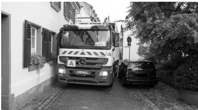
Müllabfuhr hat Probleme mit parkenden Autos

Da es selten möglich ist, die Fahrer persönlich vor Ort anzutreffen, kann die Abfuhr erst später oder gar nicht in diesen Bereichen stattfinden. Das bringt die gesamte Logistik und Planung der regulären Abfuhr durcheinander. Zudem stellen die parkenden Autos auch ein Sicherheitsrisiko für das Abfuhrpersonal dar. Straßen sind komplett blockiert, so dass zum Teil rückwärts gefahren werden muss. Die AVR Kommunal bittet um aktive Unterstützung und Rücksichtnahme an den Abfuhrtagen, um gefahrlos die Müllabfuhr durchführen zu können.