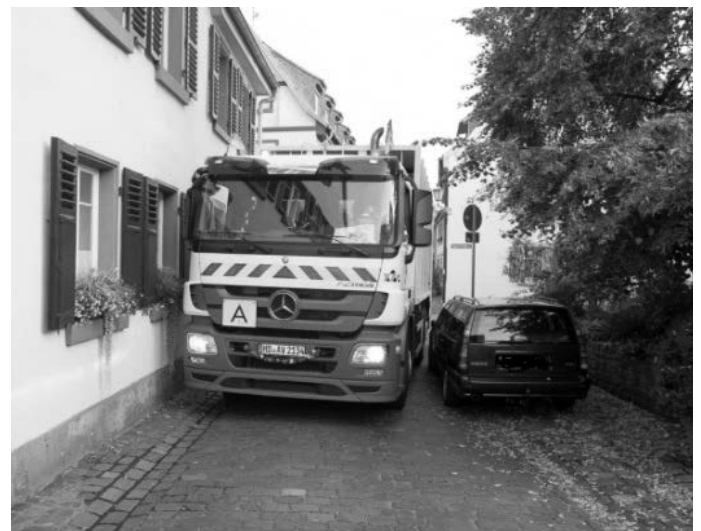
Müllabfuhr hat Probleme mit parkenden Autos

Da es selten möglich ist, die Fahrer persönlich vor Ort anzutreffen, kann die Abfuhr erst später oder gar nicht in diesen Bereichen stattfinden. Das bringt die gesamte Logistik und Planung der regulären Abfuhr durcheinander. Zudem stellen die parkenden Autos auch ein Sicherheitsrisiko für das Abfuhrpersonal dar. Straßen sind komplett blockiert, so dass zum Teil rückwärts gefahren werden muss. Die AVR Kommunal bittet um aktive Unterstützung und Rücksichtnahme an den Abfuhrtagen, um gefahrlos die Müllabfuhr durchführen zu können.